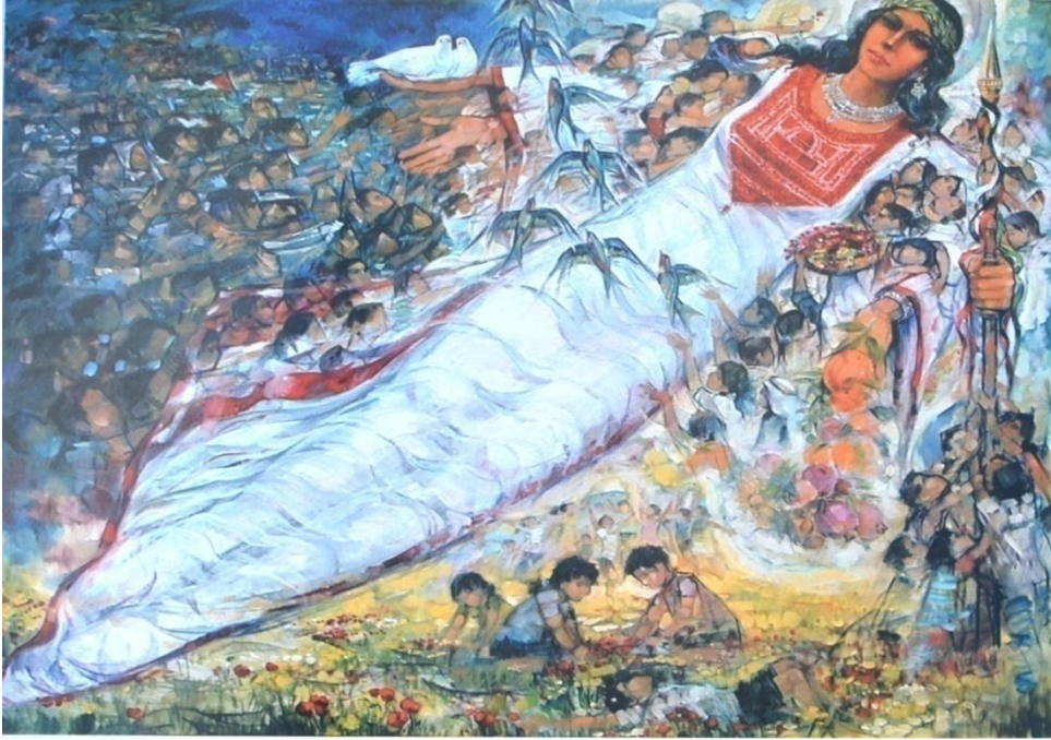
أحلام الغد، زيت على قماش، 165سم×200سم، 2000م.

ازدحمت اللوحة بالعناصر الأدبية كما في باقي أعماله شموط، حيث جاءت الكتلة الرئيسية متمثلة بالمرأة الممتدة بشكل قطري من يمين أعلى اللوحة إلى يسار أسفلها، يحملها جموع من الأطفال المحتفلين، وإلى يسار أعلى اللوحة اتجهت جموع بشرية أخرى بألوانهم الزرقاء يحملون علم فلسطين