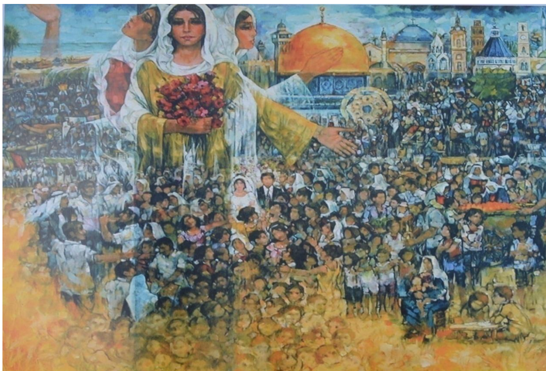
إرادة الحياة أقوى، زيت على قماش، 165سم×200سم، 1999م.

إذا جاءت "إرادة الحياة أقوى" إصراراً على استمرار الحياة الفلسطينية رغم جبروت الاحتلال وعوامل القهر والقمع، وظلت رموز الوطن شامخة في عنان السماء، والأطفال كالسنابل يتكاثرون ويتكاثرون.