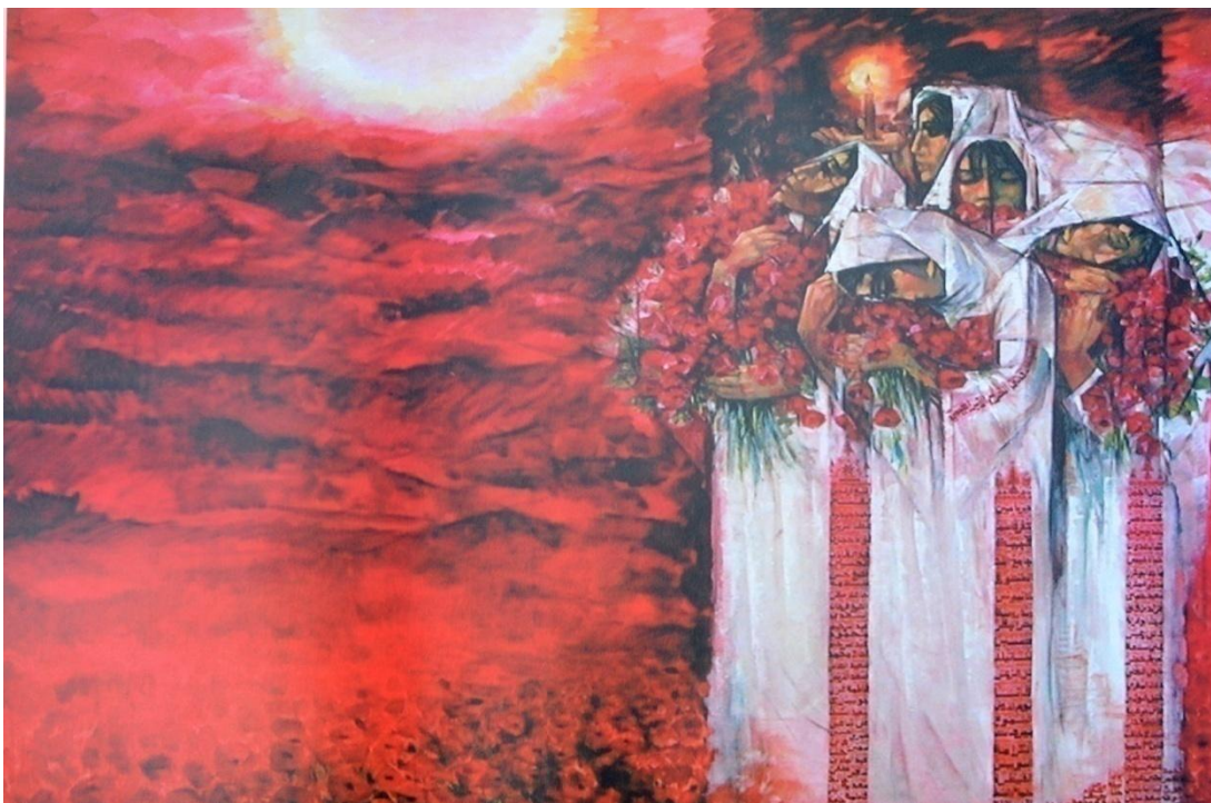
تحية للشهداء، زيت على قماش، 165سم×200سم، 1999م

صريحاً ليرمز إلى مدى عظم الفاجعة التي يرسمها الفنان. هي تحية للشهداء أيضاً، فالنساء يرتدين الثوب الفلسطيني الأبيض الأنيق بزخارفه الحمراء، يحملن باقات الورد الأحمر كأعظم تحية لأرواح ودماء هؤلاء الشهداء، ولكنهن منطويات